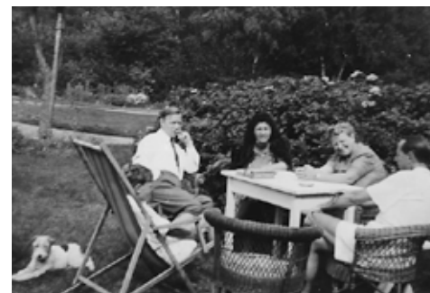
Sommeraktiviteter i parken