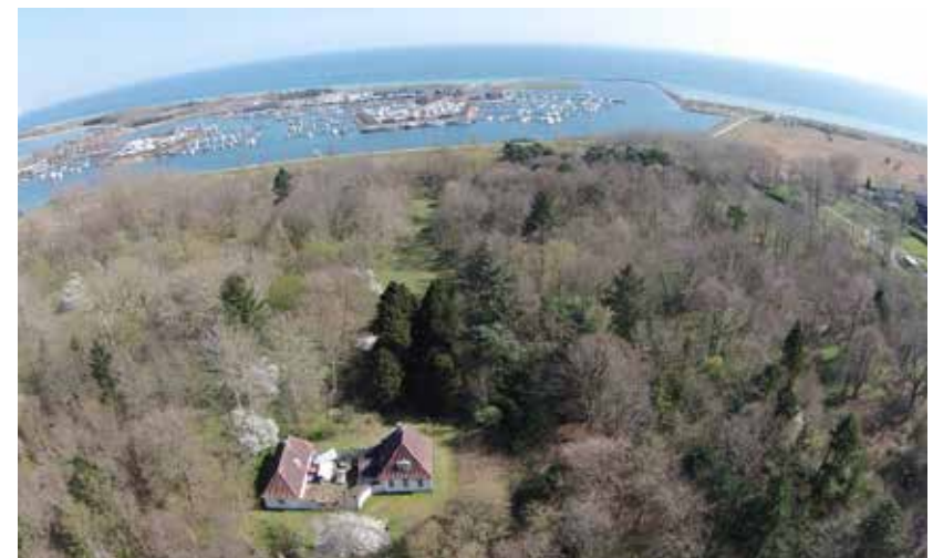
Luftfoto af den østlige del af Hundigeparken 2015