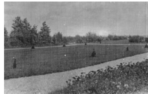
Den nyplantede nåletræs allé ved Villa Sitka