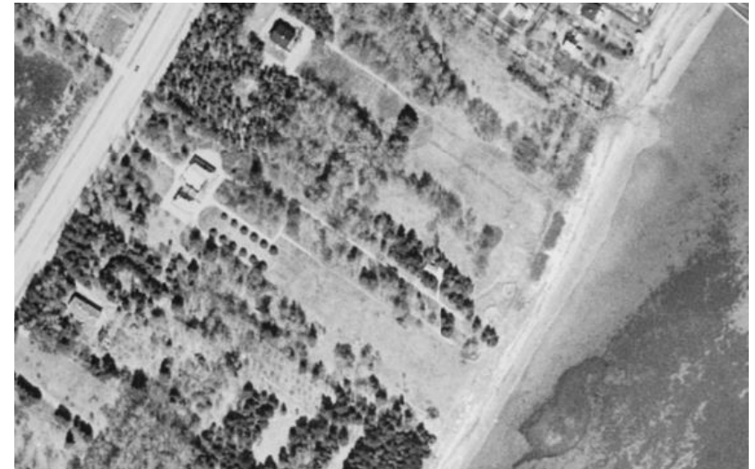
Luftfoto af den østlige del af Hundigeparken 1954

Københavns Kommune ejer Hundigeparken frem til 2014, hvor Greve Kommune køber parken med samme formål, som Københavns Kommune købte parken for 70 år siden - nemlig for at sikre borgerne grønne, rekreative arealer ved stranden.