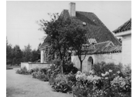
Frodigt bed ved Villa Sitka