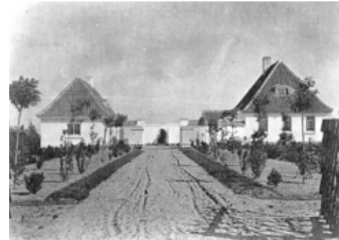
Villa Sitka set fra Strandvejen

Hvis du er nysgerrig efter at vide mere, kan du læse om historien i bilagsdelen bagerst i præsentationen.