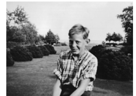
Feriebarn foran alléen ved Villa Sitka